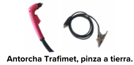
Antorcha Trafimet, pinza a tierra.