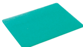
Modelo: AXT-CEPROINT04 Protector