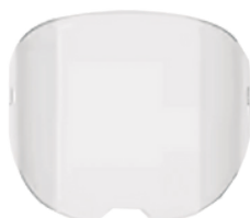
Modelo: AXT-CEPROEXT04 Protector