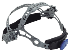
Modelo: AXT-CEARNES01 Arnés