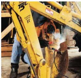
Soldadura de Electrodo Revestido con CA