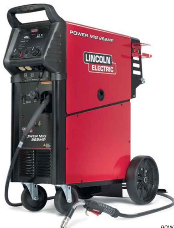
Se muestra: POWER MIG 262MP, K5376-1