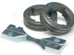
Se muestra tra: KP1697-035C, Kit de rodillo para alambres tubulares