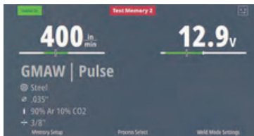
POWER MIG 262P - Pantalla de inicio con configuración guiada

Ajuste sus configuraciones con visualización de arco patentada que proporciona información gráfica instantánea sobre cómo la velocidad y el voltaje de alimentación del alambre afectan su soldadura.