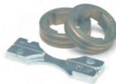
Se muestra: KP1697-035C, Kit de rodillo para alambres tubulares